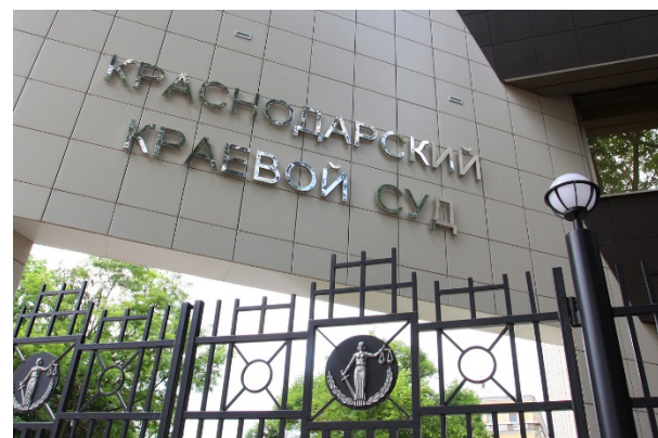
Схема пресечена: большинство денежных средств удалось спасти; организатор схемы Кошуба Д. С. приговорен к 6,5 годам колонии

Группа автоюристов начала скупать требования по договорам агрострахования и предъявлять заведомо необоснованные иски с нарушением подсудности. Только к одной из страховых компаний было предъявлено и удовлетворено более 20 исков на сумму ок. 1 млрд. рублей.